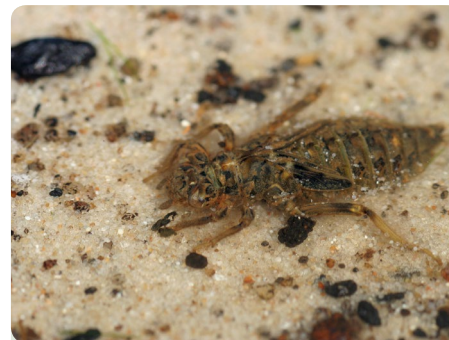
Figur 3 - Grøn kølleguldsmed - Larve

Grøn kølleguldsmed er sjælden i Danmark. Den findes kun i Jylland ved nogle store åsystemer, eksempelvis Gudenå, Karup å og Skjern å. For nylig er den også fundet ved Skals å, Siemsted å og Jordbro å.