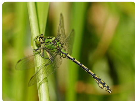
Figur 1 - Grøn kølleguldsmed - Han

Hunnen har lidt bredere bagkrop og er ikke særlig tydelig kølleformet (figur 2). Larven, der lever nedgravet i bunden af vandløb, bliver op til 30 mm og er svær at få at se (figur 3).