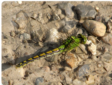
Figur 2 - Grøn kølleguldsmed - Hun

De voksne guldsmede lever af at fange insekter i luften – fluer, hvepse, sommerfugle og andre mindre guldsmede er typiske fødeemner.