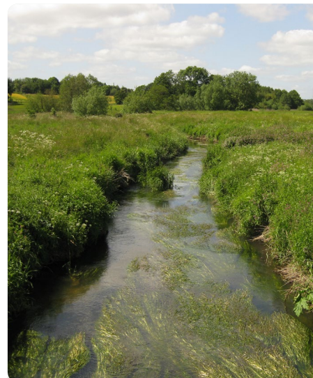
Figur 4 - Lilleåen ved Hadsten

I Favrskov kommune ved vi, at den findes langs Gudenåen og Lilleåen op til Hadsten. Det er dog sandsynligt at den er yderligere udbredt, og muligvis findes den også ved Granslev å og længere op ad Lilleåen.