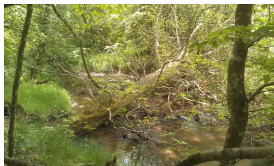
Vild natur i Bidstrupskovene

Byrådet besluttede sidste år at lave en biodiversitetsstrategi og forventer at komme ud med den offentligt i starten af 2020. Det passede fint med, at vi i forbindelse med en landsdækkende kampagne i DN opfordrede byrådet til at erklære Favrskov for Naturkommune, hvilket indebærer en klar naturpolitik. Byrådet har nu taget det til sig og det er med i budgettet. Indsatsen vil jo også stort set være indeholdt i de ting, man gerne vil lave på naturområdet.