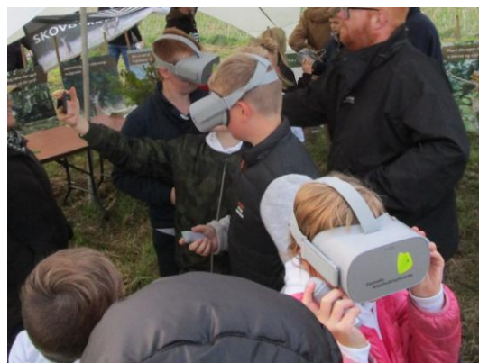
VR-briller ved DK planter træer

Vi forventer at komme med i projekt Naturfamilier næste år eller næste år igen. Det starter op i enkelte kommuner.