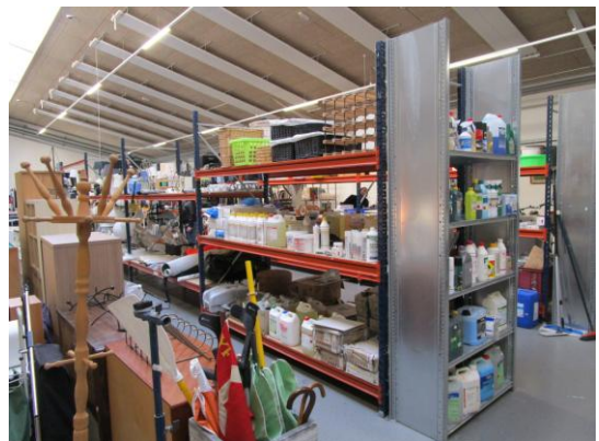
I Silkeborg genanvender man kemikalier

Desuden har vi i forbindelse med klimaugerne afholdt en høring om genbrug med deltagelse af politikere, Favrskov Forsyning og mange af kommunens indsamlingsorganisationer/genbrugsbutikker. Spørgsmålet var, hvordan man kunne øge genanvendelsen af materialer, som i dag kommer i containerne?