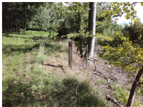
Sti ved Grundfør/ Haraldslundskoven

Se det eksisterende materiale på www.udinaturen.dk