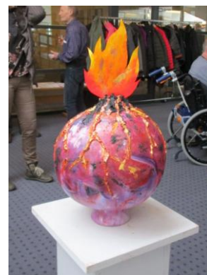
Klimakunst på Inside

Vi har i år deltaget i et udvalgsarbejde, som kommunen havde iværksat vedr. bæredygtig transport, hvor også andre interesseorganisationer var med. Det har været positivt, og der er bl.a. kommet et projekt ud af det om dele-el-biler, som vi ser frem til.