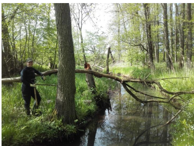
Bjørnebandemedlem ved Norring Møllebæk

Vores "Bjørneklo bande" arbejder ufortrødent videre. De områder, som vi startede med for 10 år siden, ser fine ud, om end der fortsat popper enkelte planter op hist og her på grund af tilstrømning af frø fra andre områder. De nyere områder, som vi tog ind for 4-5 år siden krævede en særlig stor indsats i starten, f.eks. langs Norring Møllebæk, men vi oplever nu at det hjælper meget.