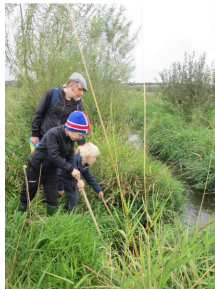
Der fanges signalkrebs