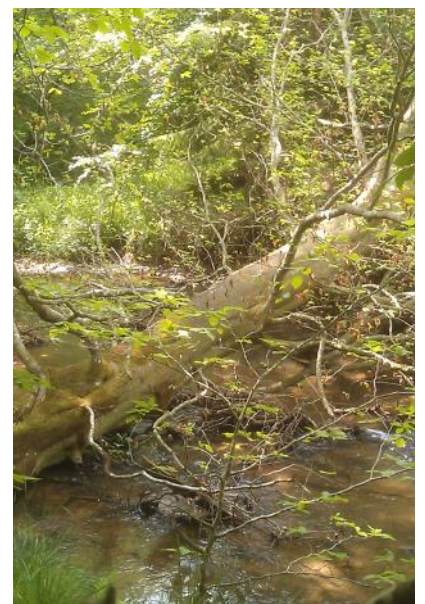
Den vilde natur langs Voer Mølle Å

Vi arbejder målrettet for fortsat at være en af de mest aktive afdelinger i landet. Hertil bruger vi bl.a. et årligt møde om strategi og handlingsplaner for afdelingen, hvor vi drøfter, hvad vi skal arbejde med i arbejdsgrupper og bestyrelse, og sætter konkrete mål for aktiviteterne. Kapitel 2 i beretningen er således i store træk en afspejling heraf for året 2022.