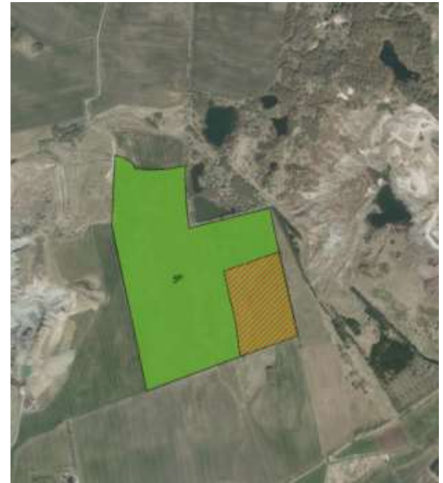
Eksempel på landzonesag ved LECA-værkets arealer